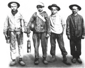
Gyermekmunka a 19. században